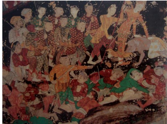
ภาพประกอบที่ 8 แสดงภาพจิตรกรรมฝาผนังวัดสุวรรณาราม สมัยรัตนโกสินทร์ตอนต้น

การใช้สีที่มีความหลากหลาย เช่น สีดำ ขาว แดง เขียว น้ำตาล ฟ้า เหลือง เขียว และสีทอง เป็นต้น ด้วยกระบวนการดังกล่าวส่งผลให้ผลงานในชุดนี้ให้ความรู้สึกสดชื่นด้วยคำสีที่มีความหลากหลาย พร้อมๆ กับคำนำหน้าที่น่าประทับใจปรากฏในตัวผลงานที่มีความชัดเจนมากยิ่งขึ้น