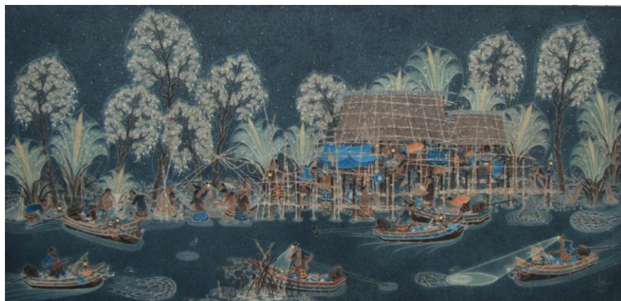
ภาพประกอบที่ 11-12 แสดงภาพผลงานสร้างสรรค์ชุด สุนทรียะในความคิด