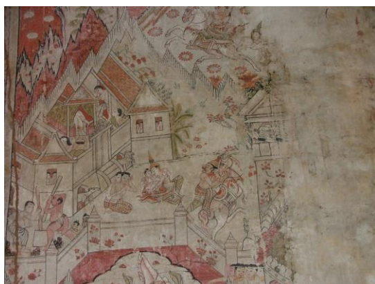
ภาพประกอบที่ 5 แสดงภาพจิตรกรรมฝาผนังวัดช่องนนทรี สมัยอยุธยาตอนต้น

ใหญ่จะเป็นโครงสร้างเครื่อง เช่นสีน้ำตาล สีแดง สีขาวและสีดำ ซึ่งกระบวนการดังกล่าวได้กลายเป็นที่มาของสาระสำคัญในการสร้างสรรค์ผลงานชุดนี้