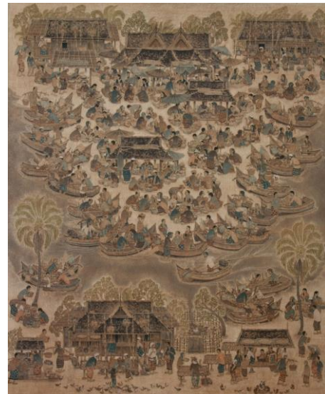
ภาพประกอบที่ 6-7 แสดงภาพผลงานสร้างสรรค์ชุด วิถีชีวิตพื้นถิ่นปักษ์ใต้