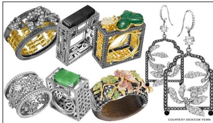
ภาพประกอบที่ 6 ผลงานออกแบบเครื่องประดับของ Dickson Yewnเป็นผลงานออกแบบเครื่องประดับร่วมสมัย มีการผสมผสานกลิ่นอายของความเป็นตะวันออก ศิลปะลวดลายจีนโบราณในงานสถาปัตยกรรมบวกกับรูปทรงสมัยใหม่