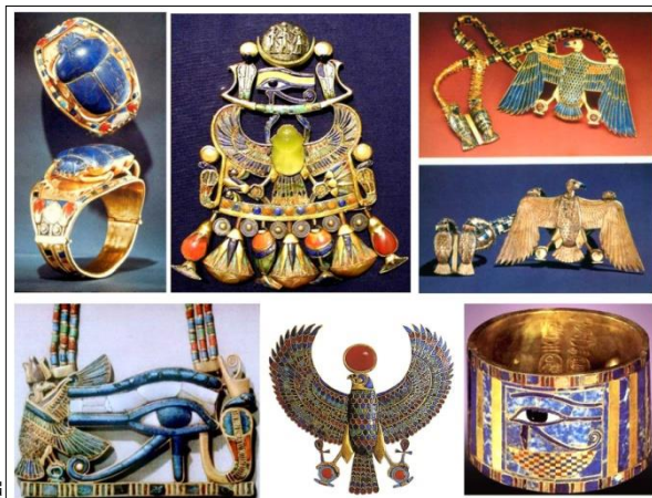
ภาพประกอบที่ 1 เครื่องประดับอียิปต์โบราณของพระมหากษัตริย์อียิปต์โบราณ ประมาณ 1,500 ปีก่อนคริสตศักราช

เครื่องประดับอียิปต์โบราณ เป็นตัวอย่างรูปแบบเครื่องประดับลักษณะต้นแบบโบราณชาวอียิปต์มีความเชื่อทางไสยศาสตร์อย่างแรงกล้า และมีความคิดว่าถ้าได้จำลองบุคคลทางศาสนาขึ้นเป็นสัญลักษณ์อยู่ในอัญมณีแล้ว ความดีงามทั้งหลายจากเทวดาจะถ่ายเทมายังผู้สวมใส่ รูปของ สการ์ับ scarab แมลงปีกแข็งคล้ายๆแมลงกุดจี ซึ่งเป็นสัญลักษณ์ของสุริยเทพและการกลับชาติมาเกิด นับเป็นลวดลายที่เป็นที่นิยม รูปของเหยี่ยวก็ปรากฏอยู่บ่อยๆเป็นสัญลักษณ์ของสุริยเทพ ภูเขา หรืออีกชื่อหนึ่งเรียกว่า อูเรอัส (แม่เบ๊ย) เป็นสัญลักษณ์ของอียิปต์ตอนล่าง และพญาแร้ง หมายถึงอียิปต์ตอนบน เมื่อนำสัญลักษณ์ทั้งสองนี้มาใช้ร่วมกันบนเครื่องแต่งศีรษะและในอัญมณี ก็จะหมายถึงการรวมอียิปต์ตอนล่างและตอนบนเข้าด้วยกันอยู่ใต้อำนาจของฟาโรห์เพียงองค์เดียว พระเนตรของกษัตริย์แห่งกาลจะเป็นรูปดวงตามนุษย์ที่ทำให้ดูผิดธรรมชาติ แล้วใช้เป็นสัญลักษณ์ของดวงจันทร์ รูปบัวบานหรือรูปต้นปาปิรุสแยมบาน รูปทรงสัตว์ ถือเป็นสิ่งที่มาจากท้องถิ่นที่ถูกนำมาดัดแปลงเป็นลวดลายประดับ (พรสนอง วงศ์สิงห์ทอง, 2547)