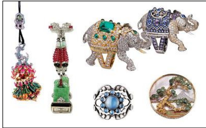
ภาพประกอบที่ 5 ภาพผลงานการออกแบบเครื่องประดับของDior, Boucheron, Cartier, George Jensen, Bulgari คอลเล็คชั่นปี 2012โดยผลงานมีที่มาแรงบันดาลใจจากศิลปะวัฒนธรรมตะวันออก