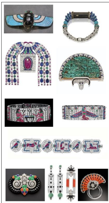
ภาพประกอบที่ 2 ผลงานการออกแบบสไตล์อาร์ตเดโคของ Cartier และ Van Cleef & Arpel

เรขาคณิต ทั้งนี้ทั้งนั้นมีการคำนึงถึงความสมดุลมากขึ้น ซึ่งถือเป็นหัวใจสำคัญแสดงถึงความหนักแน่น ทั้งรูปแบบต่างๆและสีสันของอัญมณีที่จัดจ้านได้ถูกนำมาใช้ให้เกิดประโยชน์ ซึ่งถือเป็นจุดเด่นสำคัญของอาร์ตเดโค รูปทรงของเครื่องประดับยุคอาร์ตเดโคจะมีรูปแบบกระต๊อดและลวดลายที่ได้รับอิทธิพลจากวัฒนธรรมอียิปต์โบราณ โดยมีการนำรูปแบบลวดลายภาพวาดผนัง, เครื่องประดับกาย, เครื่องราง มาดัดแปลง ตัดทอน อ้างอิงกันว่ามีการค้นพบสุสานของกษัตริย์ตุตันคาเมน(ในปีค.ศ.1922) จะเห็นได้ชัดว่าในสมัยนั้นแบรนด์เครื่องประดับระดับโลกอย่าง Cartier มีการผลิตเครื่องประดับในเชิงลักษณะกึ่งยุโรป-อียิปต์ออกมา ที่เป็นที่ยื่นชื่อระดับโลกคือเข็มกลัดแมลงทับ