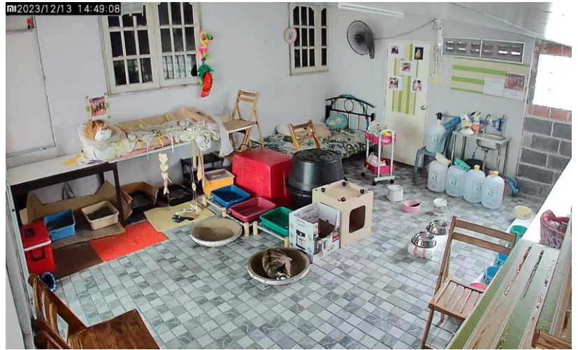
ภาพแสดงที่อยู่ของแมว ก่อนและหลังปรับปรุง

ชีวิตที่มีแมว แม่จะมีความรับผิดชอบที่มากขึ้น มีความเหนื่อยซึ้นกว่าเดิม แต่พอได้กอดหอม และรับรู้ได้ว่ามีความรักรอเราอยู่ที่บ้าน กลับทำให้เรามีพลัง มีความรับผิดชอบ มีความอบอุ่นในหัวใจ ทำให้เรายังอยากมีชีวิตต่อ ผมจะทำให้ความรักครั้งนี้คงอยู่ต่อไปนับเป็นสิบๆปี เพราะตอนนี้พวกเขาไม่ใช่แค่แมว แต่คือสมาชิกในครอบครัวของผม My Meow...my love