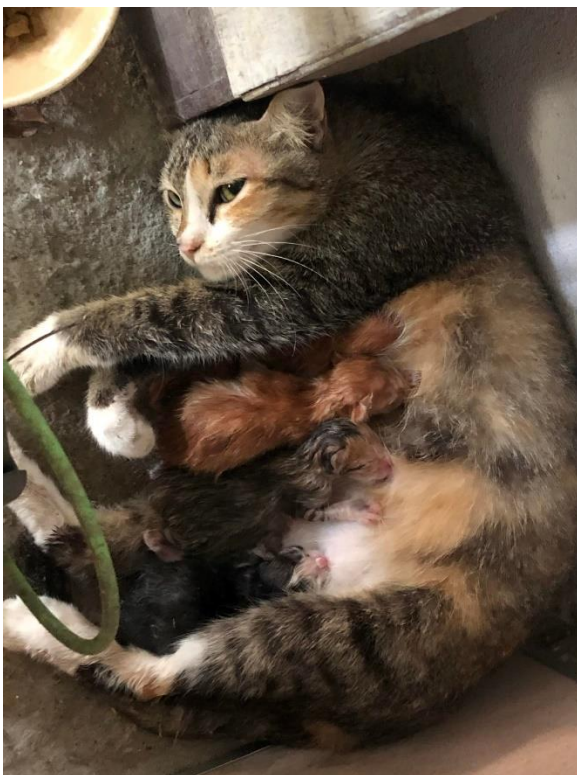
ภาพหน้าต่างคลอดลูก ๆ 20 เมษายน 2564

ชีวิตใหม่ในการมีแมวให้ดูแล 6 ตัว เปลี่ยนไปมาก ๆ มีชีวิตตัวเล็ก ๆ ให้เราเป็นห่วง กังวล ใ้รับผิดชอบ ทั้งการต้องตื่นไวขึ้นเพื่อเผื่อเวลาสำหรับการให้อาหารในตอนเช้า การเก็บอึในกระบะทรายในตอนเย็น การต้องคอยดูแลหยอดยากันพยาธิให้ครบหมด การจับอาบน้ำ การให้ความรักความเอาใจใส่ ซึ่งทั้งหลายเหล่านั้นนอกจากต้องใช้ทั้งเงินแล้ว ยังต้องแบ่งเวลาให้อีกด้วย และทำให้เป็นกิจวัตรประจำวันแบบใหม่ที่เปลี่ยนแปลงชีวิตของผมไปเลย คือการตามถ่ายภาพและคลิปวิดีโอเวลาที่เด็ก ๆ ทำตัวน่ารัก จนตั้งเป็นช่องในแอปพลิเคชัน Tiktok เพื่อเอาไว้อลงความน่ารักของเด็ก ๆ ไม่ใช่แต่เพียงผมเท่านั้น เด็ก ๆ