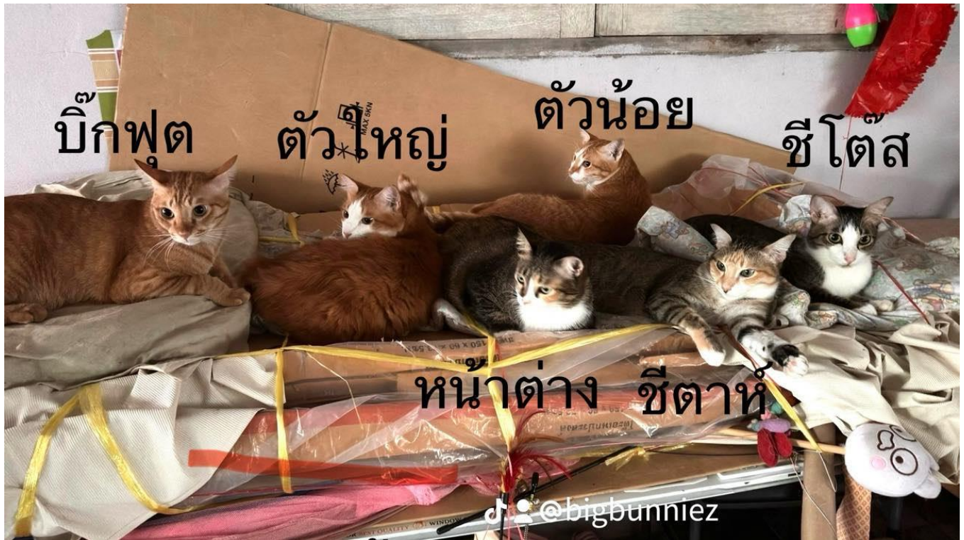
ภาพแสดงสมาชิกแมวทั้งหมดในบ้าน

คนดูแลจัดการได้ จึงเริ่มตั้งชื่อให้เด็ก ๆ ทั้งหมด โดยมีส่วนผู้ 4 ตัวและตัวเมีย 1 ตัว โดยตัวผู้ทั้ง 4 นั้น มีชื่อว่า ตัวใหญ่ ตัวน้อย บิ๊กฟุต และซีโต้ส สำหรับตัวเมียนั้นชื่อว่า ซีตาร์ท