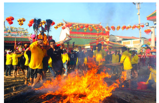
พระหมอทำพิธีลุยน้ำ ลุยไฟ