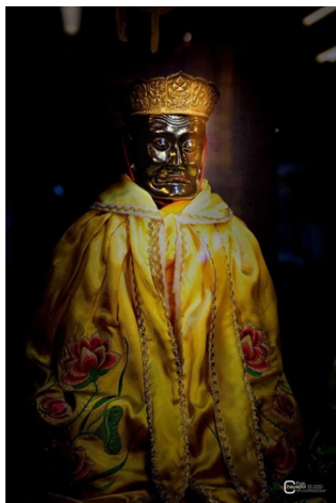
โจวซือกง หรือ พระหมอ พระประธานประจำศาลเจ้าเล่งจูเกียง

ประวัติการอัญเชิญพระหมอมาประดิษฐานที่ศาลเจ้าฯ (โดยย่อ) เมื่อร้อยกว่าปีก่อนมีชาวบ้านได้ไปพบขอนไม้สีดำลอยมาติดอยู่ที่บริเวณสะพานบั้งฉิ่ง คลองอานะฮง ซึ่งปัจจุบันเป็นถนนปัตตานีภิรมย์ ชาวบ้านผู้นั้นจึงใช้มีดขอสับขึ้นมาเพื่อนำไปทำเป็นไม้ฟัน หลังจากใช้มีดฟันลงไปปรากฏว่ามีน้ำสีแดงคล้ายเลือดไหลมาจากท่อนไม้นั้น องค์พระโจวซือกงได้ประทับทรงชาวบ้านผู้นั้นแล้วอุ้มท่อนไม้สีดำนั้นขึ้นมาจากคลอง คุณพระจินคณานุรักษ์ทราบเรื่องจึงรีบมาดู พบว่าท่อนไม้นั้นอันที่จริงแล้วเป็นไม้แกะสลักเป็นองค์พระขนาดใหญ่ จึงได้อัญเชิญไปประดิษฐาน ณ ศาลเจ้าปูนเถ่ากง ที่ตลาดจีน(เกียดาจีนอ) เป็นองค์ประธานของศาลเจ้า ชาวบ้านจึงเรียกศาลเจ้าปูนเถ่ากงใหม่ว่า “ศาลโจวซือกง” (ก่อนมีการอัญเชิญเจ้าแม่ลิ้มกอเหนี่ยวมาประดิษฐานแล้วเปลี่ยนชื่อเป็น "ศาลเจ้าเล่งจูเกียง") หลังจากนั้นพระเฒ่าจ้อยโจวซือ หรือ พระหมอจึงเป็นที่เคารพสักการะของชาวจีนในเมืองปัตตานี