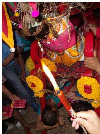
การทำพิธีปักหลักไฟ