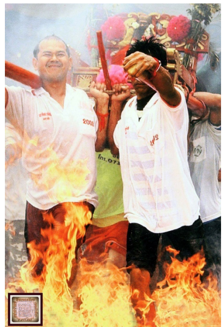
เจ้าที่แป๊ะกงเข้าพิธีลุยน้ำ ลุยไฟ