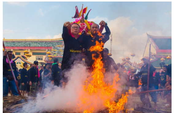
ศิษยานุศิษย์อัญเชิญเจ้าแม่ลิ้มกอเหนี่ยว เข้าพิธีลุยน้ำ ลุยไฟ