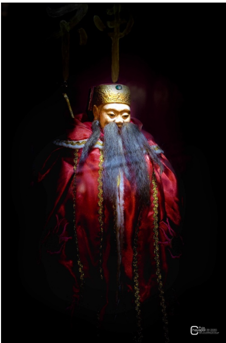
เจ้าที่แป๊ะกง

ทั้งนี้คำว่า แป๊ะกง ก็คือ เจ้าที่ ถ้าเป็นคนไทยก็จะเรียกกันว่าศาลตายาย หรือเทพยาผีดิน ซึ่งเป็นความเชื่อที่ว่าทุกหนทุกแห่งนั้นจะมีเจ้าที่คุ้มครองและดูแลผืนแผ่นดินนั้นมาอยู่ช้านาน ถึงได้ต้องมีการเซ่นไหว้วิญญาณของผู้ที่ดูแลสถานที่แห่งนั้น เพื่อความอยู่เย็นเป็นสุข ห้างร้านที่เราทำการค้าขาย จำต้องมีรูปเจ้าที่(เจ้าพระยาผีดิน) นี้ไว้ในที่อยู่อาศัย หรือที่ทำการค้าขาย เพื่อความเป็นอยู่เย็นเป็นสุข การค้าขายที่เจริญรุ่งเรือง และครอบครัวที่อยู่อย่างสงบสุข อีกหนึ่งความเชื่อก็คือ เจ้าที่แป๊ะกงจะทำหน้าที่เป็นคนนำคำอธิษฐานของชาวบ้านไปบอกกับเทพในศาล