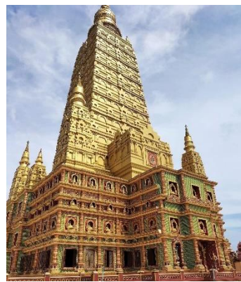
พระมหาธาตุเจดีย์