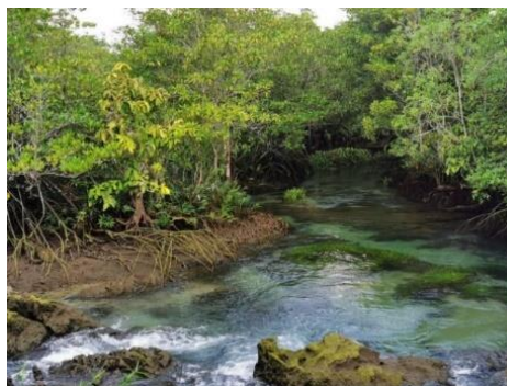
น้ำสีฟ้าอมเขียวสดใส