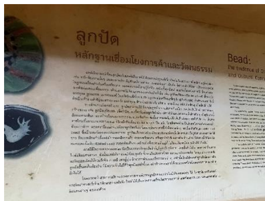
ข้อมูลการค้นพบลูกปัด