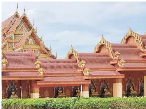
พระพุทธรูปต่างๆ ที่ล้อมรอบองค์เจดีย์ทั้ง 4 ด้าน

ท่าปอมคลองสองน้ำ ตั้งอยู่ที่บ้านหนองจิก ตำบลเขาคราม อำเภอเมือง จังหวัดกระบี่ ท่าปอมเป็นชื่อป่าดิบชื้นและป่าพรุติดเชิงเขาหินปูนในตำบลเขาคราม ป่าผืนนี้เป็นต้นกำเนิดลำคลองสายสั้นๆ มีน้ำใสสะอาดมาก ไหลลงสู่ทะเลอันดามัน ชาวบ้านเรียกว่าคลองสองน้ำเป็นป่ามหัศจรรย์ที่อยู่ใกล้เมืองกระบี่ เนื่องจากในช่วงที่มีน้ำทะเลหนุนสูงน้ำในคลองที่จัดสนิทจะกลางเป็นน้ำกร่อย ครั้นเมื่อน้ำลงน้ำจืดจากป่าต้นน้ำก็ผลักดันน้ำเค็มไปจนหมด ท่าปอมคลองสองน้ำเป็นสถานที่ท่องเที่ยวเชิงนิเวศวิทยาเพื่อศึกษาธรรมชาติและชมธารน้ำใสสีฟ้าอมเขียว โดยทางเดินเป็นสะพานไม้ยกสูง มีระยะทางประมาณ 1.2 กิโลเมตร เส้นทางเดินเป็นวงกลม ระหว่างทางเดินจะได้สัมผัสกับธรรมชาติที่ร่มรื่น ทั้งป่าดิบชื้น ป่าพรุน้ำจืด ป่าชายเลน มีพันธุ์ไม้นานาชนิด รวมทั้งได้ชมความสวยงามของรากไม้ และระหว่างเส้นทางจะมีจุดที่สามารถลงเล่นน้ำได้ ในวันนั้นผู้เขียนไปเที่ยวช่วงเช้าทำให้เห็นน้ำสีฟ้าอมเขียวสดใส ซึ่งเจ้าหน้าที่แนะนำว่าควรไปเที่ยวช่วงเช้าเพราะน้ำในคลองเป็นน้ำจืด จึงทำให้น้ำใสแต่ถ้ามีน้ำทะเลหนุนสูงขึ้นน้ำในคลองจะเป็นน้ำกร่อยและมีสีฟ้าค่อนข้างขุ่น