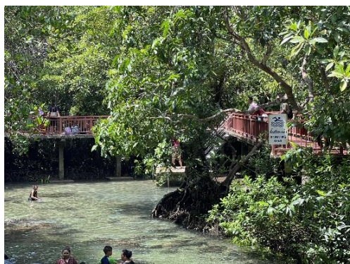
จุดที่ให้ลงเล่นน้ำ