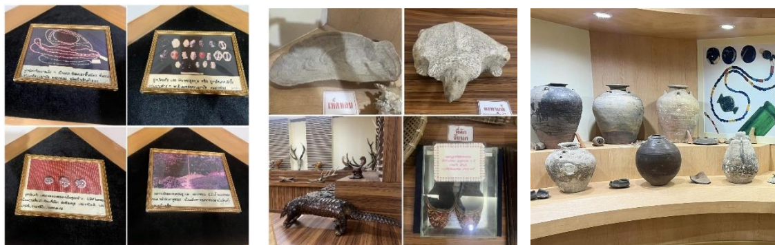
ลูกปัดโบราณและโบราณวัตถุที่จัดแสดงในพิพิธภัณฑ์

การไปเที่ยวจังหวัดกระบี่ครั้งนี้ได้ทำบุญ ได้ความรู้ และได้ชมธรรมชาติอันสวยงาม ซึ่งผู้เขียนก็ได้ไปเที่ยวกระบี่มาหลายครั้งเพราะชอบเที่ยวทำปอมคลองสองน้ำที่ได้เดินชมธรรมชาติ ถ้ามีโอกาสอยากให้ท่านผู้อ่านลองไปเที่ยวดูสักครั้ง นอกจากได้พักผ่อนแล้ว ยังเป็นการสนับสนุนคนไทยด้วยกันจากการท่องเที่ยวในประเทศที่มีสถานที่ท่องเที่ยวที่สวยงามไม่แพ้ที่ใด