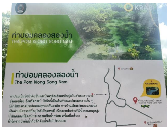
ป้ายด้านหน้าทางเข้า

ท่าปอมคลองสองน้ำ ตั้งอยู่ที่บ้านหนองจิก ตำบลเขาคราม อำเภอเมือง จังหวัดกระบี่ ท่าปอมเป็นชื่อป่าดิบชื้นและป่าพรุติดเชิงเขาหินปูนในตำบลเขาคราม ป่าผืนนี้เป็นต้นกำเนิดลำคลองสายสั้นๆ มีน้ำใสสะอาดมาก ไหลลงสู่ทะเลอันดามัน ชาวบ้านเรียกว่าคลองสองน้ำเป็นป่ามหัศจรรย์ที่อยู่ใกล้เมืองกระบี่ เนื่องจากในช่วงที่มีน้ำทะเลหนุนสูงน้ำในคลองที่จัดสนิทจะกลางเป็นน้ำกร่อย ครั้นเมื่อน้ำลงน้ำจืดจากป่าต้นน้ำก็ผลักดันน้ำเค็มไปจนหมด ท่าปอมคลองสองน้ำเป็นสถานที่ท่องเที่ยวเชิงนิเวศวิทยาเพื่อศึกษาธรรมชาติและชมธารน้ำใสสีฟ้าอมเขียว โดยทางเดินเป็นสะพานไม้ยกสูง มีระยะทางประมาณ 1.2 กิโลเมตร เส้นทางเดินเป็นวงกลม ระหว่างทางเดินจะได้สัมผัสกับธรรมชาติที่ร่มรื่น ทั้งป่าดิบชื้น ป่าพรุน้ำจืด ป่าชายเลน มีพันธุ์ไม้นานาชนิด รวมทั้งได้ชมความสวยงามของรากไม้ และระหว่างเส้นทางจะมีจุดที่สามารถลงเล่นน้ำได้ ในวันนั้นผู้เขียนไปเที่ยวช่วงเช้าทำให้เห็นน้ำสีฟ้าอมเขียวสดใส ซึ่งเจ้าหน้าที่แนะนำว่าควรไปเที่ยวช่วงเช้าเพราะน้ำในคลองเป็นน้ำจืด จึงทำให้น้ำใสแต่ถ้ามีน้ำทะเลหนุนสูงขึ้นน้ำในคลองจะเป็นน้ำกร่อยและมีสีฟ้าค่อนข้างขุ่น