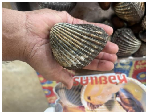
หอยแครงตัวใหญ่มาก

ที่สำคัญเมื่อเดินชมธรรมชาติเสร็จก็มาทานอาหารทะเลที่ร้านท่าปอมซีฟู๊ด ซึ่งตั้งอยู่บริเวณลานจอดรถ ถือเป็นร้านอาหารที่มีราคาไม่แพง อาหารทะเลสดและอร่อย จุดเด่นของร้าน คือ หอยแครงธรรมชาติตัวใหญ่ (ประมาณ 12-13 ตัว/กิโลกรัม) แต่ที่ร้านบอกว่าบางวันอาจจะมีตัวเล็กกว่านี้ ซึ่งตอนที่ผู้เขียนไปถือว่าโชคดีที่มี หอยแครงตัวใหญ่